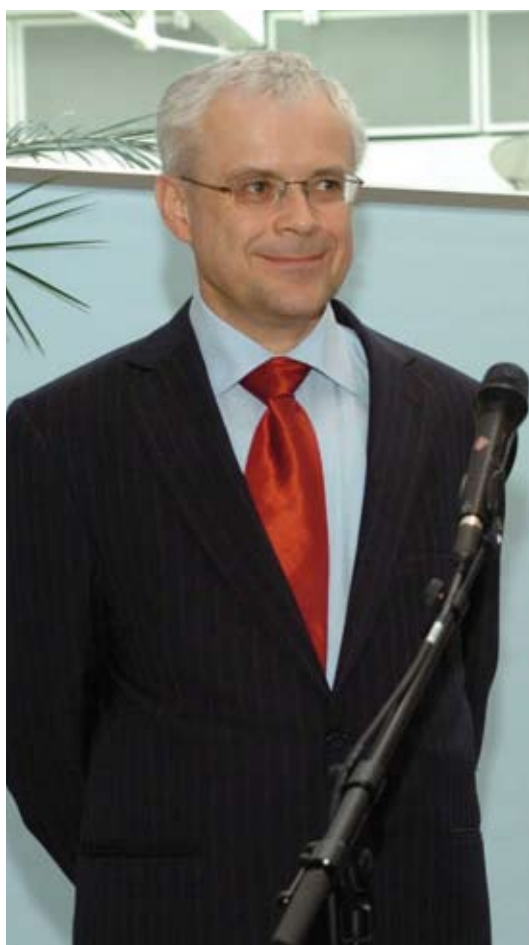
Vladimír Špidla, předseda poroty, evropský komisař pro zaměstnanost, sociální věci a rovné příležitosti, Česká republika

Mezinárodní kolo soutěže proběhlo pod patronátem Vladimíra Špidly, člena Evropské komise a Komisaře pro zaměstnanost, sociální věci a rovné příležitosti.