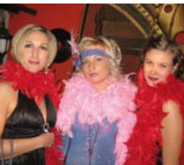
Členové týmu TRITON Hunters na vánočním večíрку ve stylu 30. let