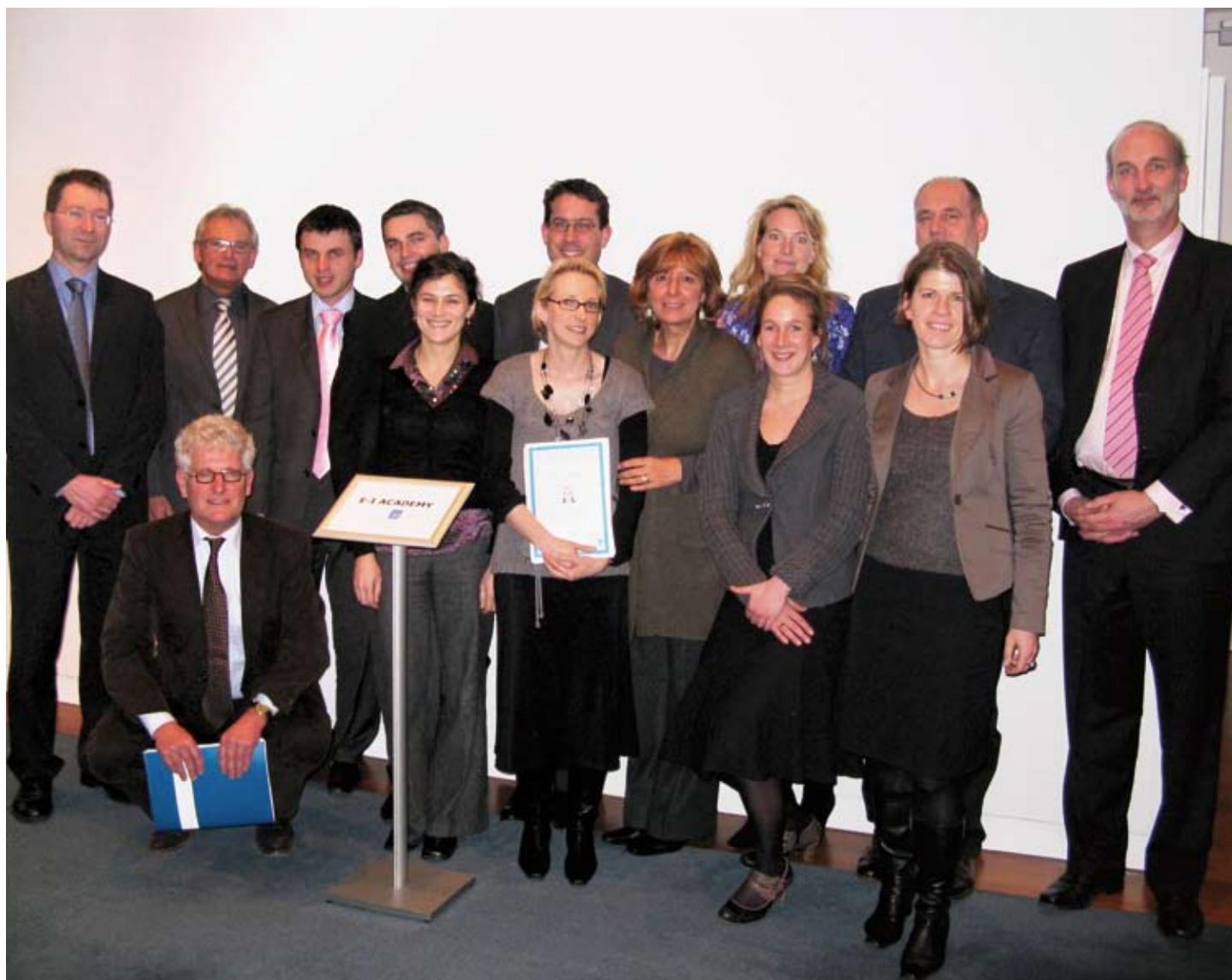
Tým účastníků E-I Academy, zástupci E-I Consulting Group a společnosti NEDAP

s nedostatkem pitné vody, si účastníci E-I Academy vyzkoušeli možnosti, jak do podnikatelských aktivit zahrnout a aktivně zapojit největší a zároveň nejchudší socioekonomickou skupinu na světě tak, aby byl výsledný efekt spolupráce oboustranně přínosný.