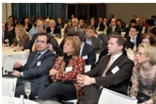
Představitelé společností Praxi (Itálie) a Orga (Francie)